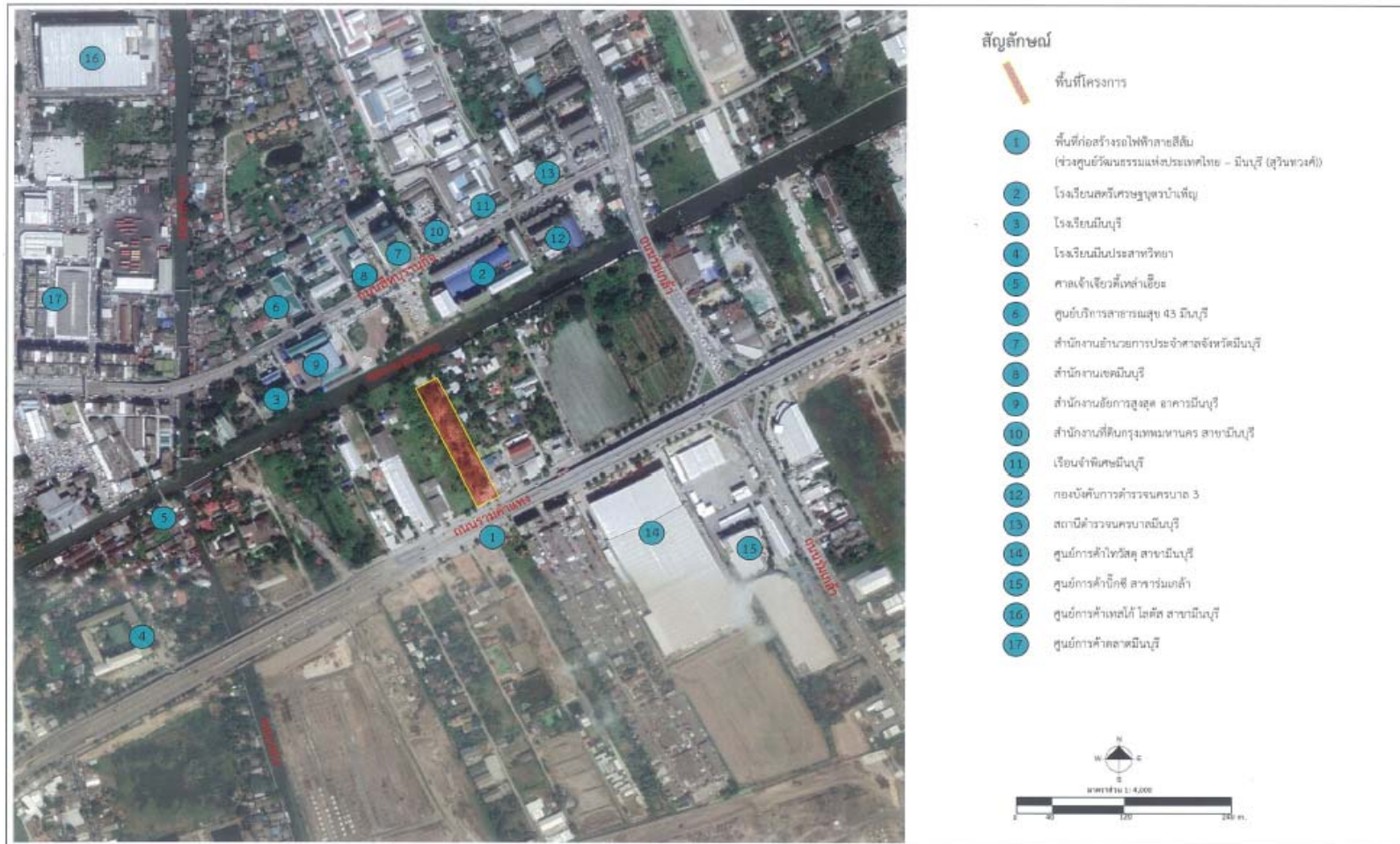
รูปที่ 2.1-3 ฟังแสดงสภาพแวดล้อมบริเวณพื้นที่โครงการในมาตราส่วน 1 : 4,000